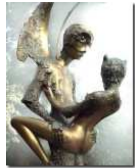
GIACOMO DE PASS